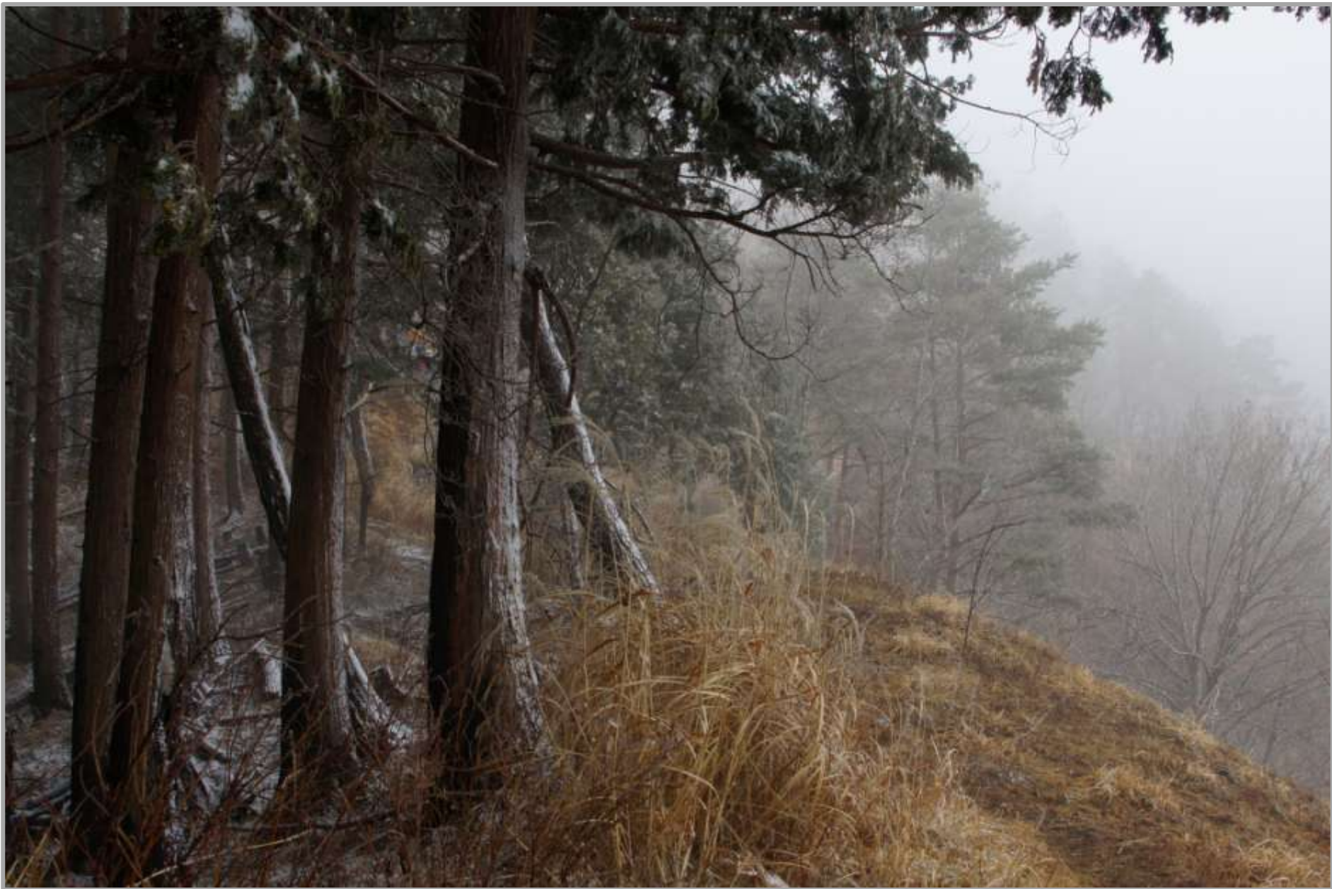
造林と萱ヶ原。この一帯の典型的な景観だ。