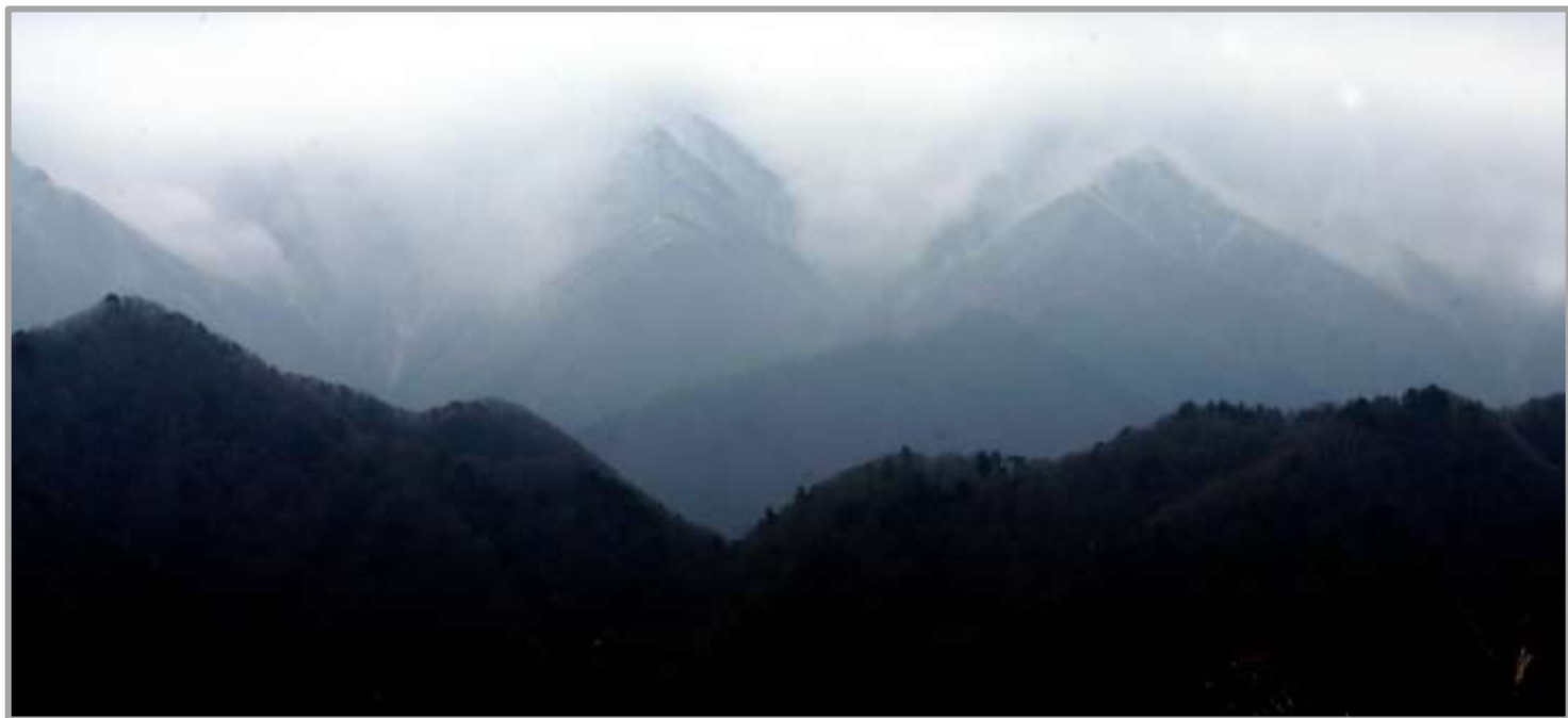
南側 笹子雁ヶ腹摺山方面