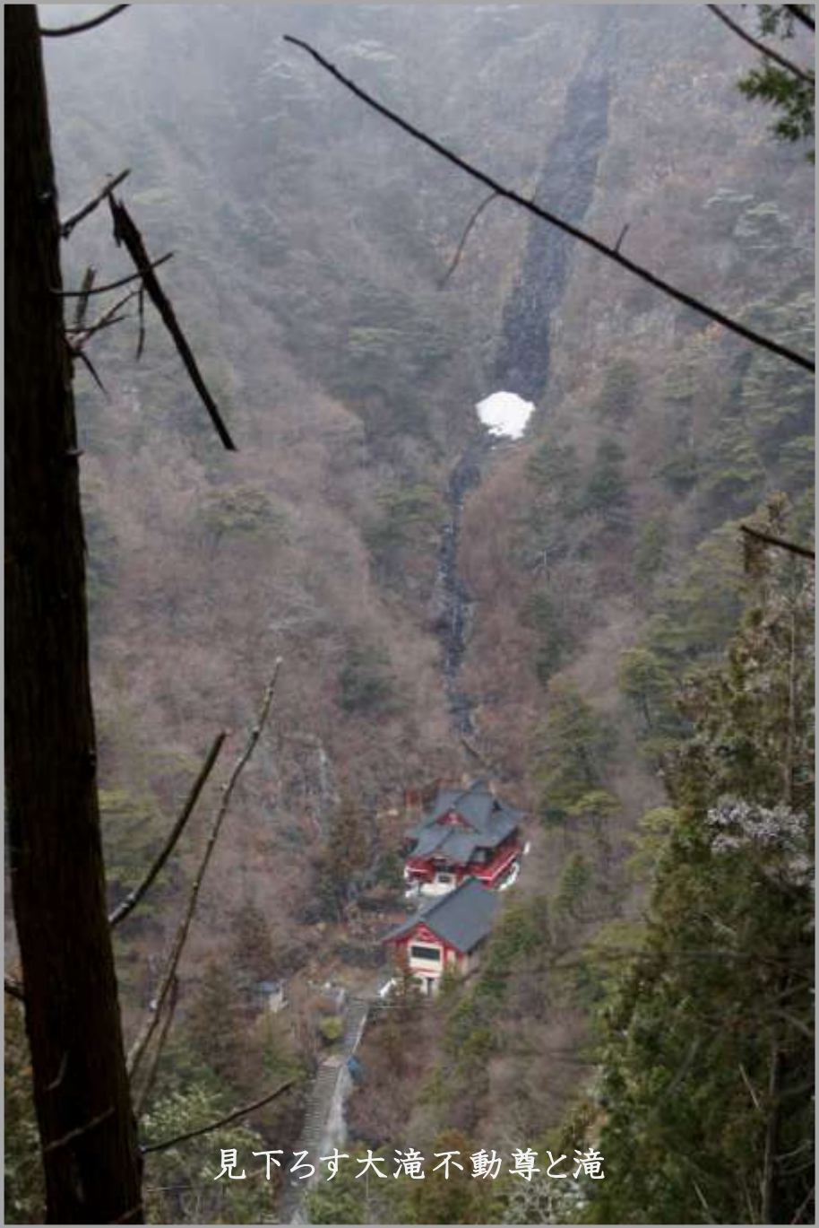
見下ろす大滝不動尊と滝