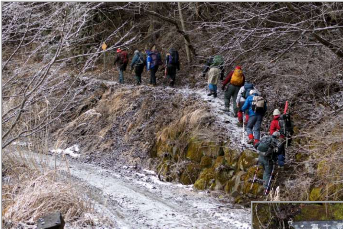
林道と登山道があちこちで交錯する