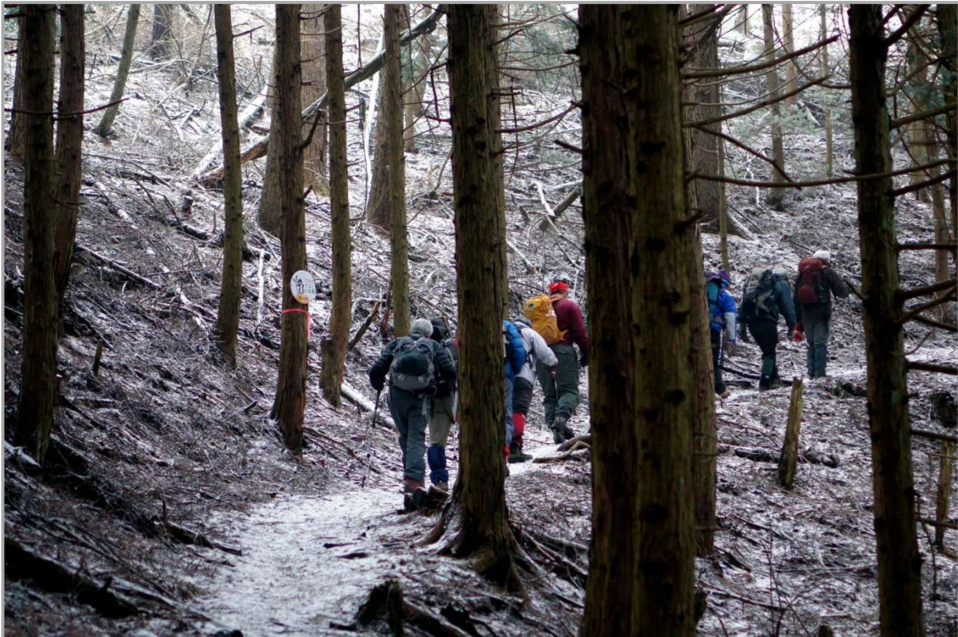
11人の男たちがひっそりと杉林の中を進む。チベットのラマ僧の行列の様で、おのずと祈りがわきあがる。