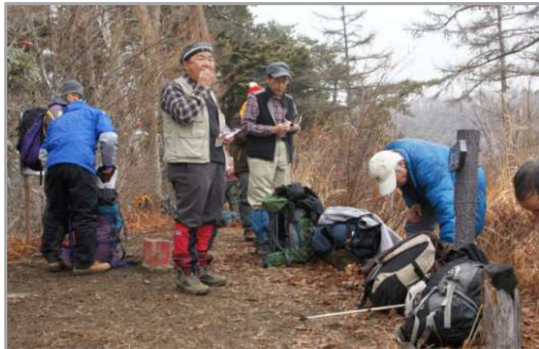
平成になって既に4度も山火事が起こり、南面は明るく開けている。香港の山と同じだ。