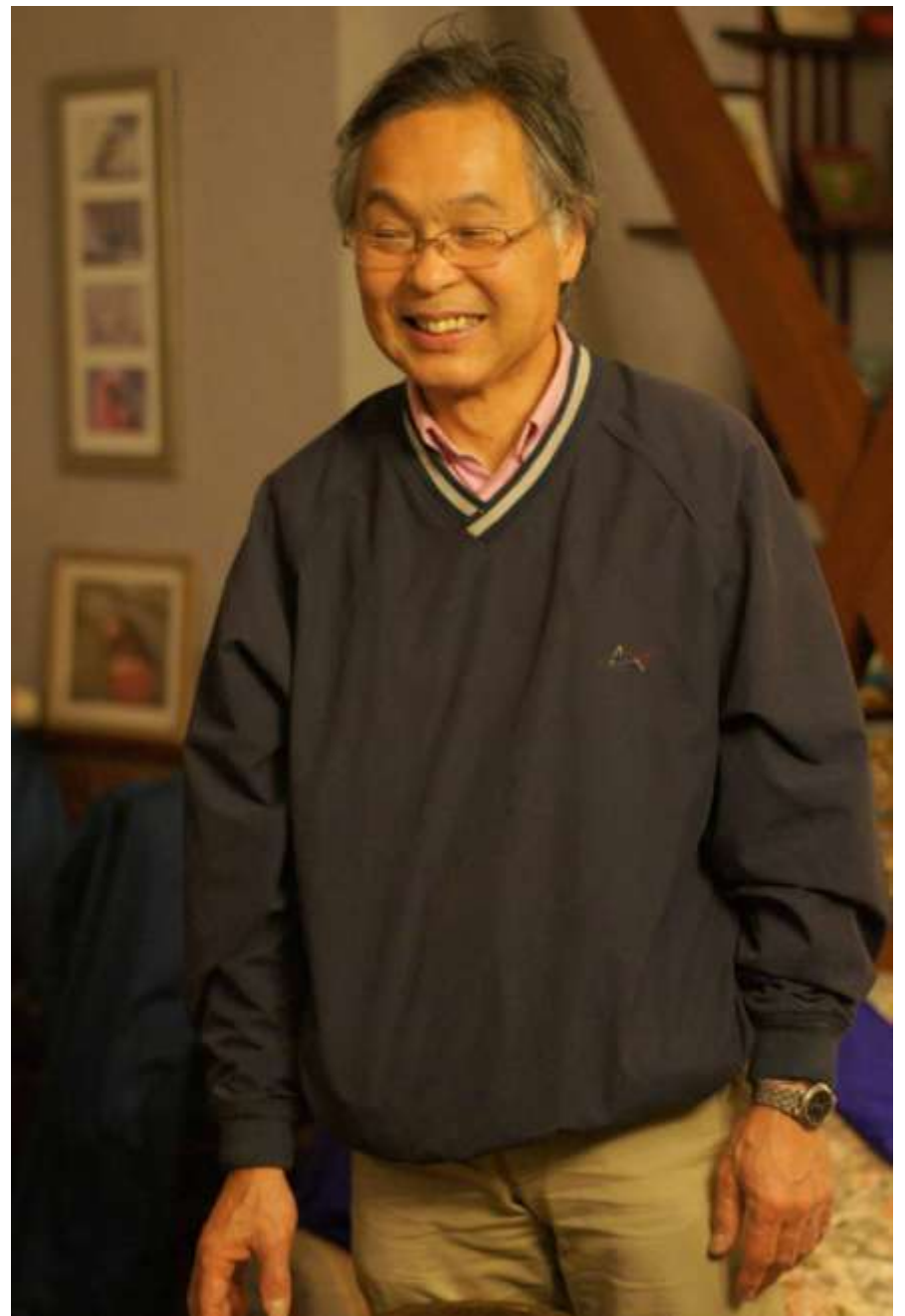
アダージオは永遠に不滅です