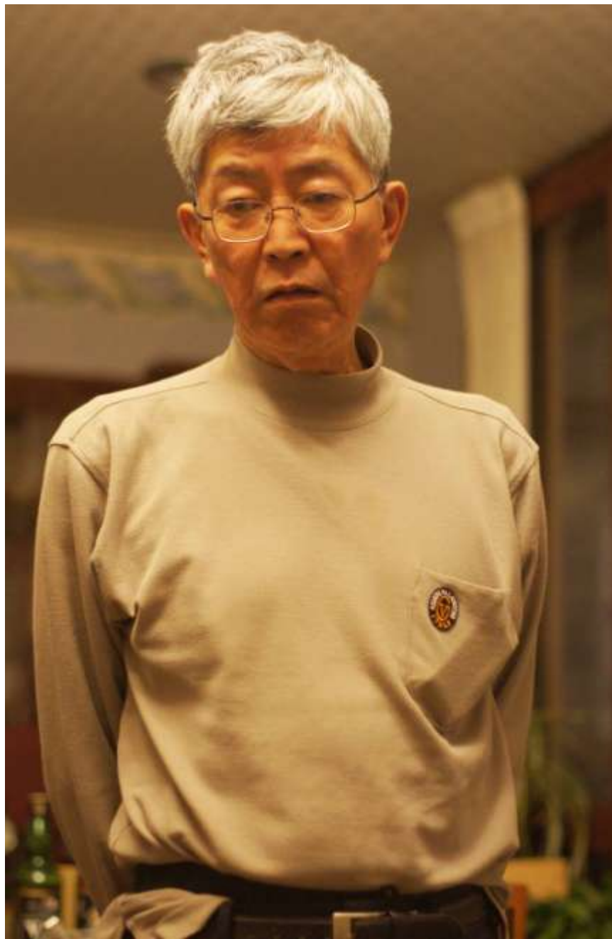
この日のためにジョギング訓練、健康管理第一