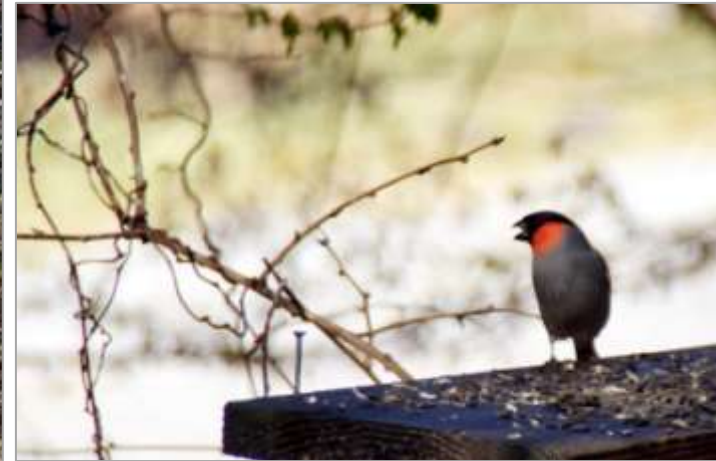
アダージオとうそ