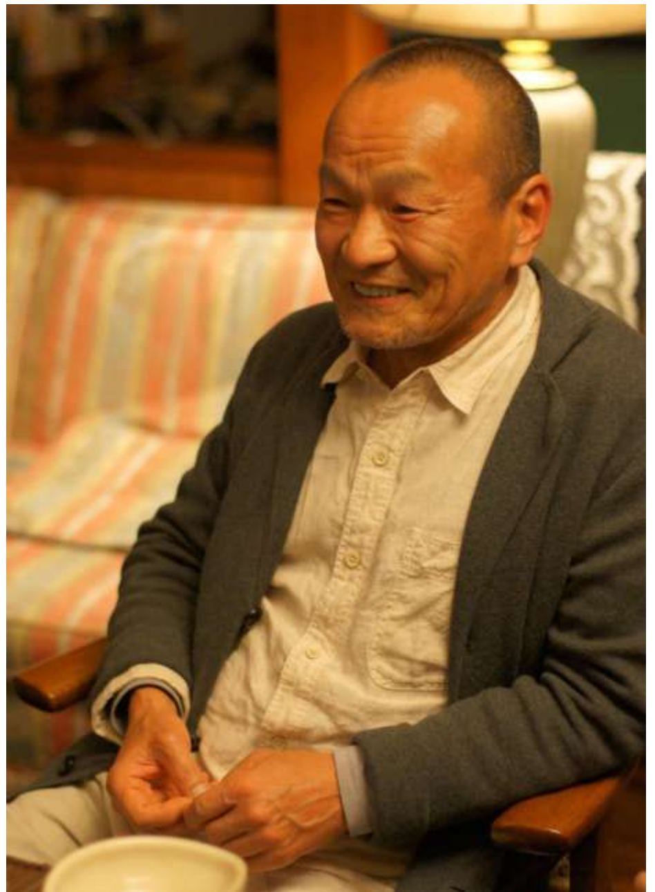
ああ、あの戸川節は今でも健在。