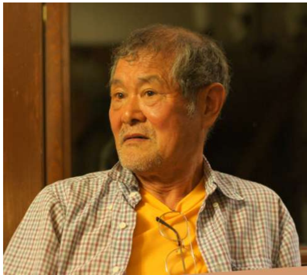
いよいよ募る野武士の風格