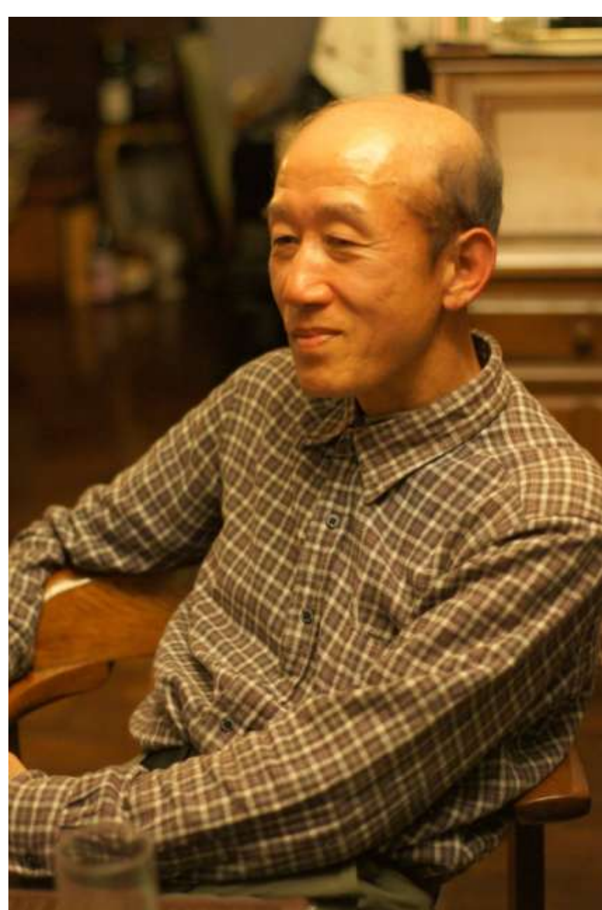
仙人藤原。相貌もxx聖人に近くなってきた。 山中時速7KM。