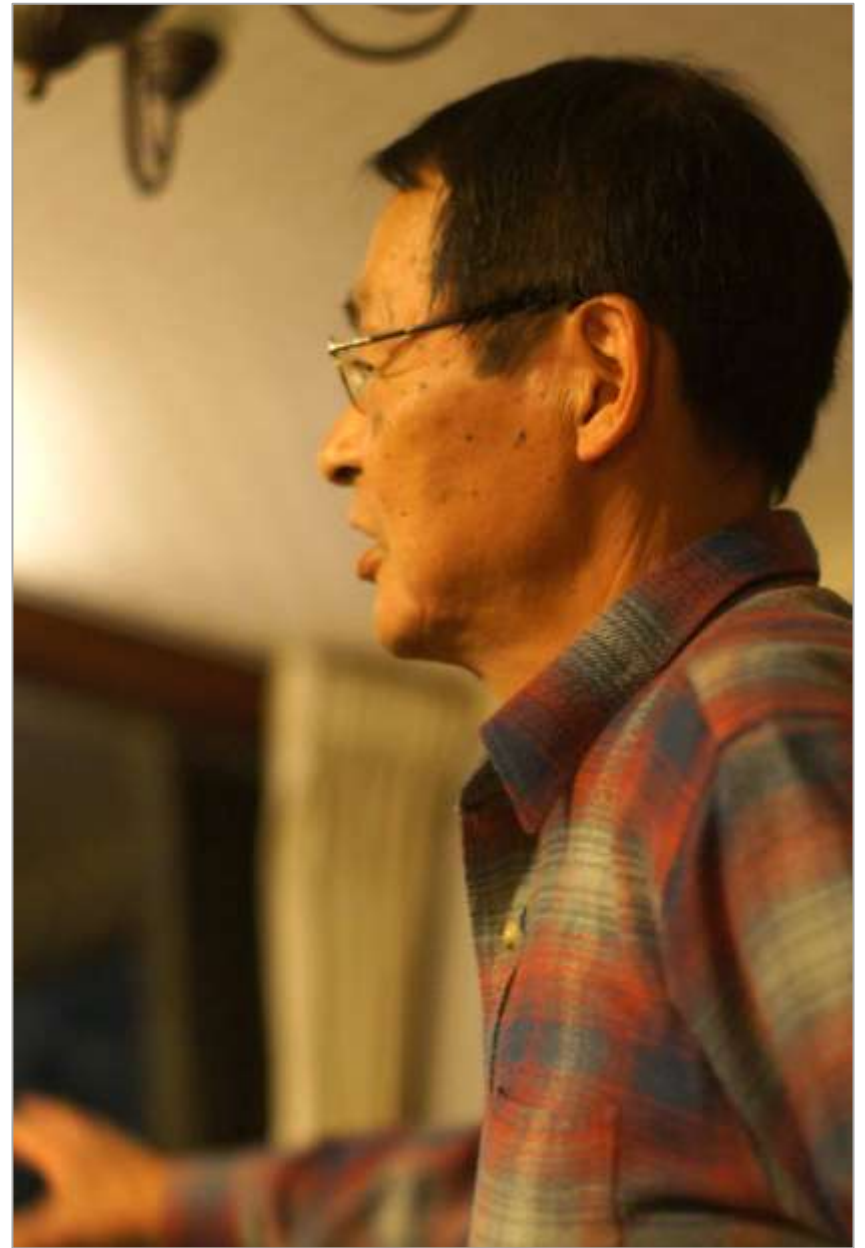
心やさしき山岳神士