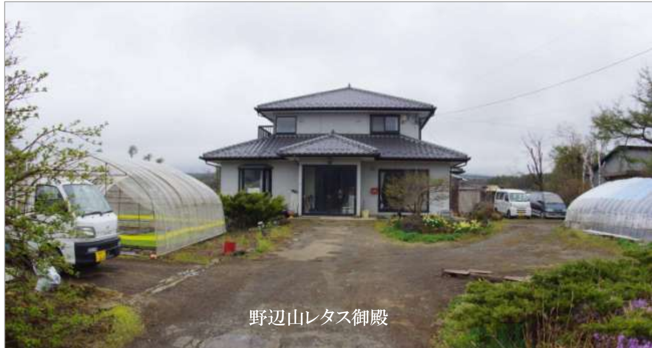
野辺山レタス御殿