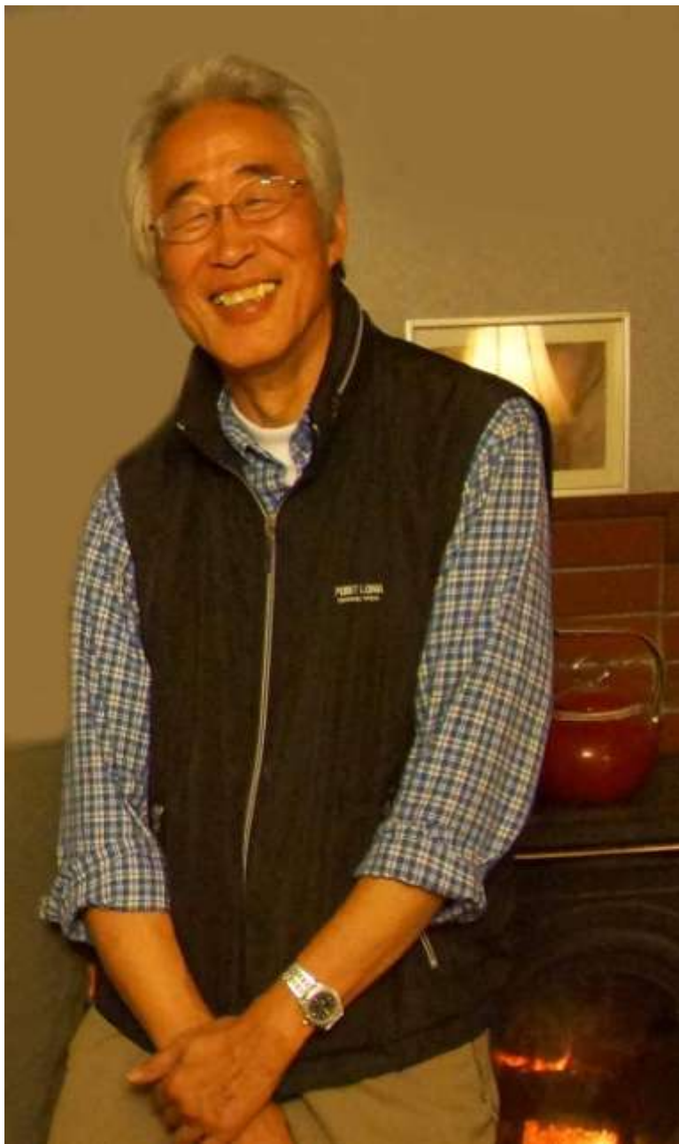
移住したばかりの岡山から上京。さすがに遠い。