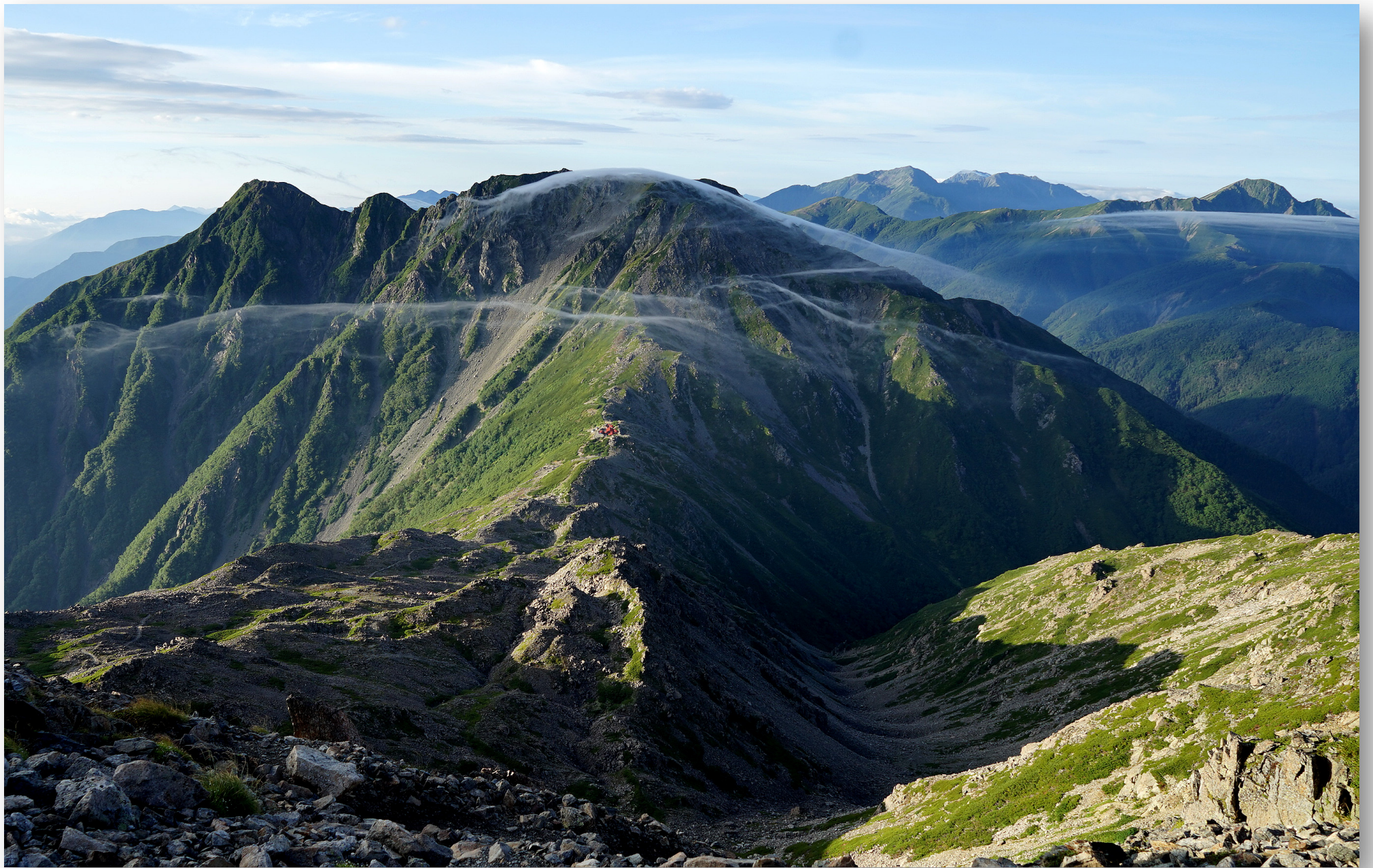
農鳥岳（3026m）が絹雲のベールをかぶる。