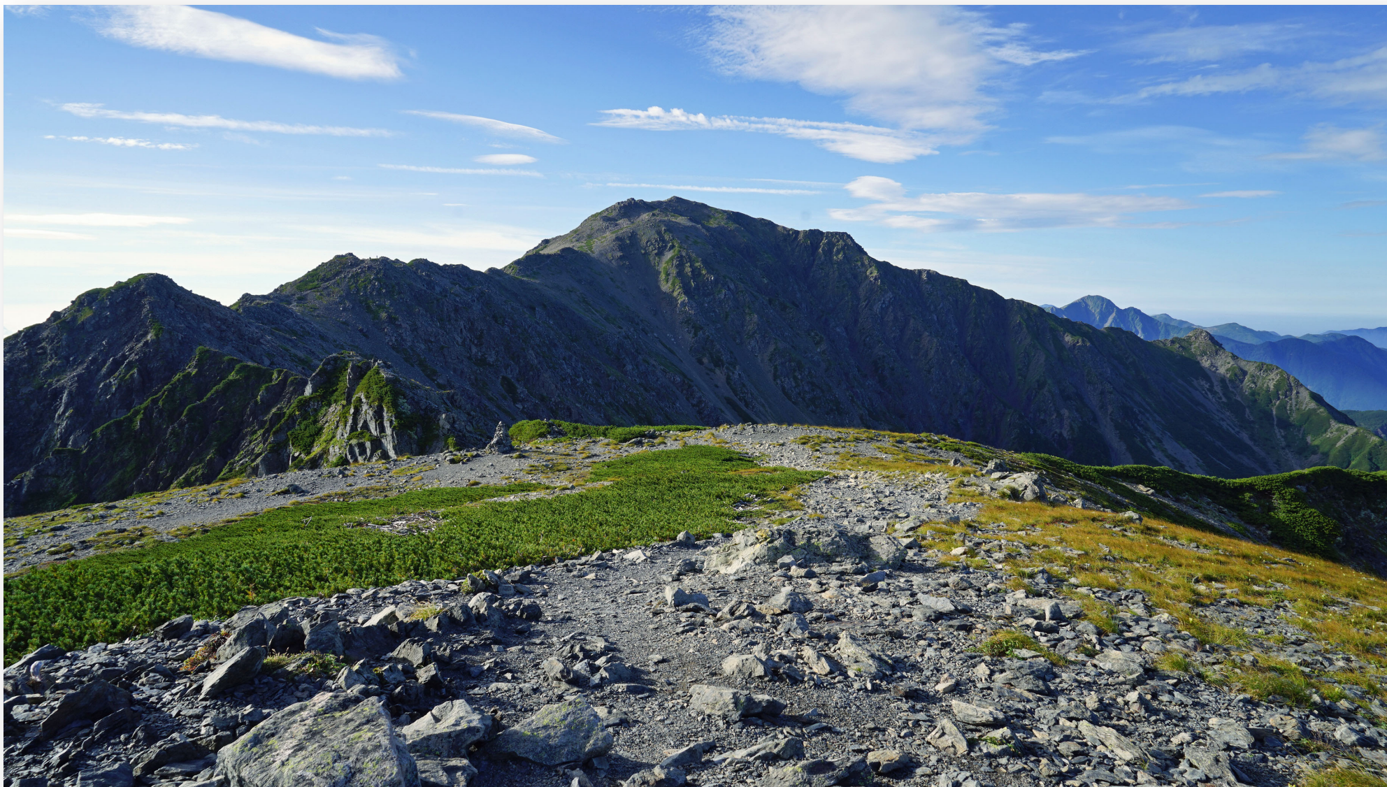
中白根岳より間の岳。高度3千mを超える道。