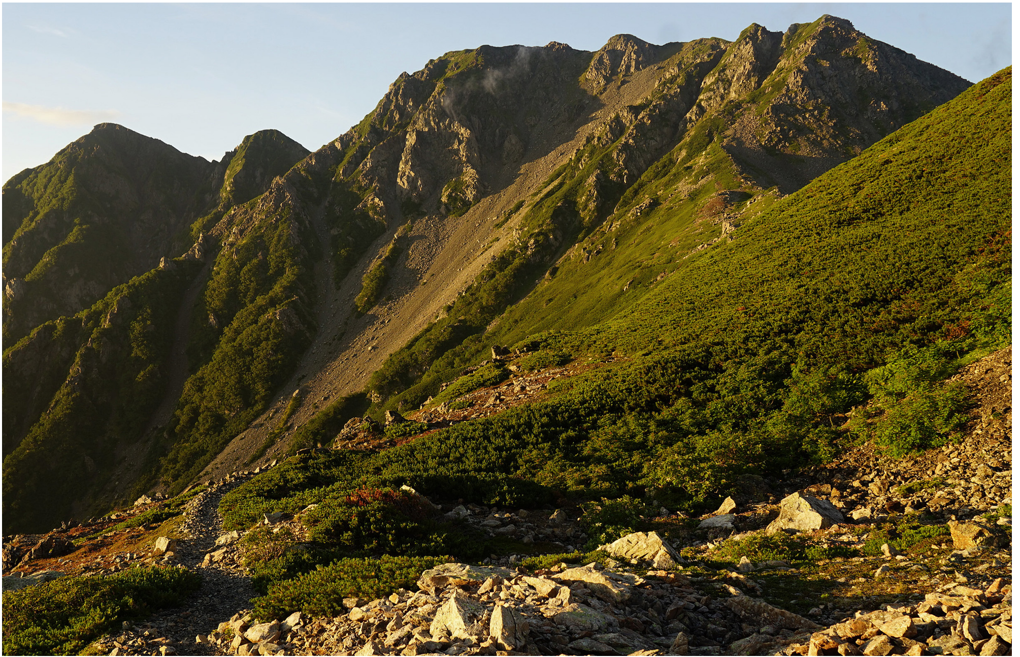
農鳥岳が朝陽に染まり色を変える。