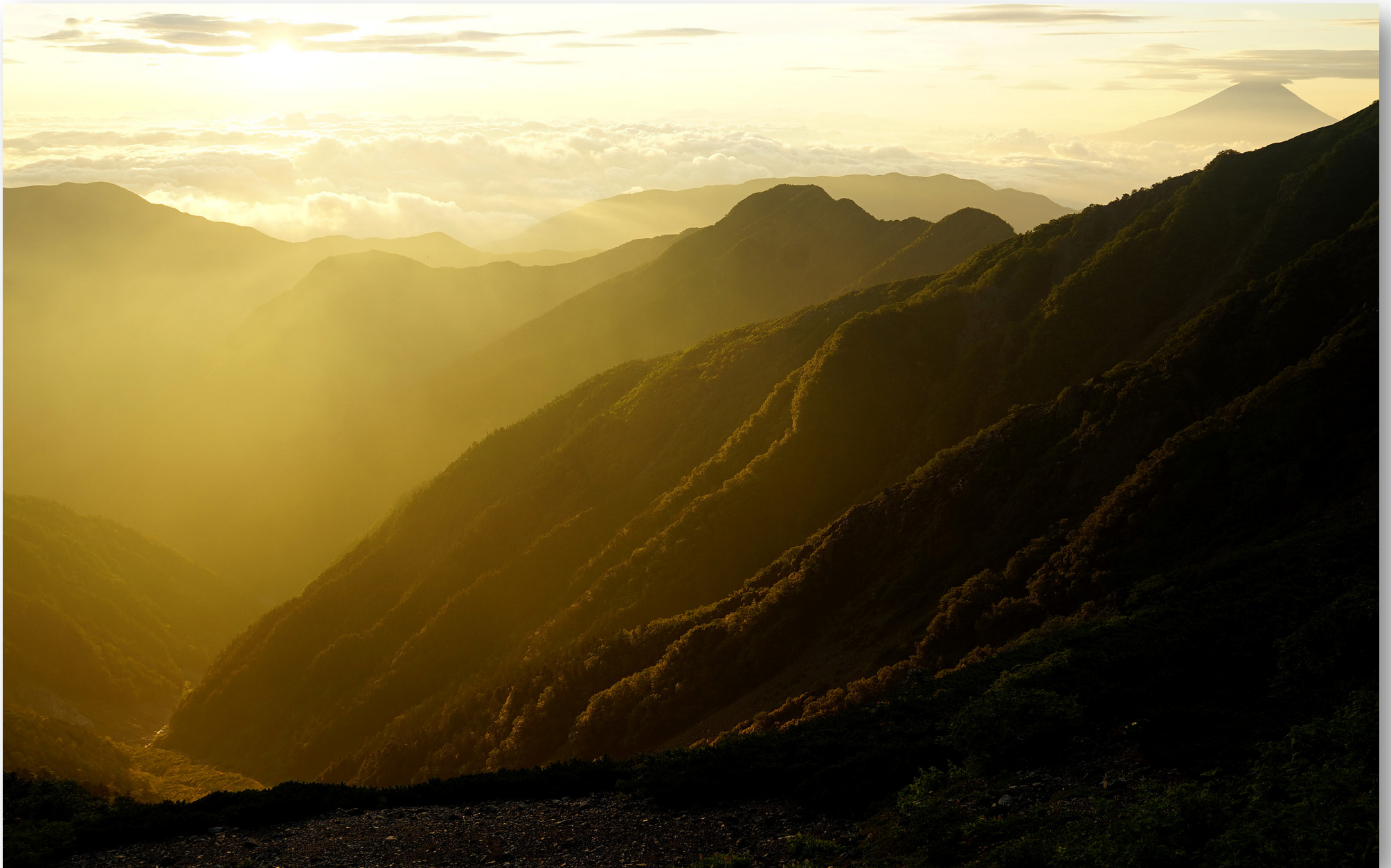
富士川の源流荒川本谷が朝陽に輝く。