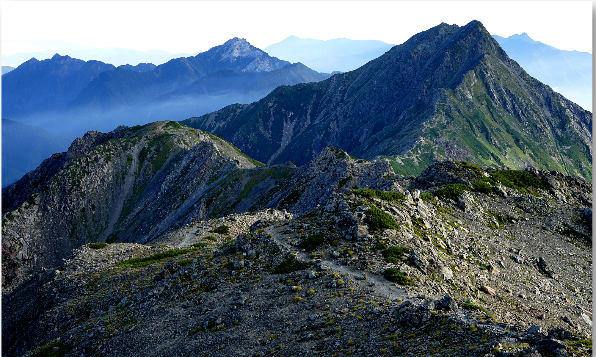
北岳（3193m 手前）と、甲斐駒ヶ岳（2967m 奥）、そして八ヶ岳の大型山稜。