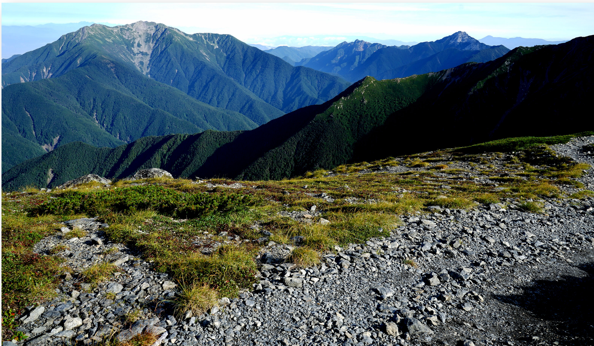
仙丈岳（3033m 左）と甲斐駒ヶ岳（2967m 右）。 この位置はぼくにはおそらく40年ぶりの眺め。