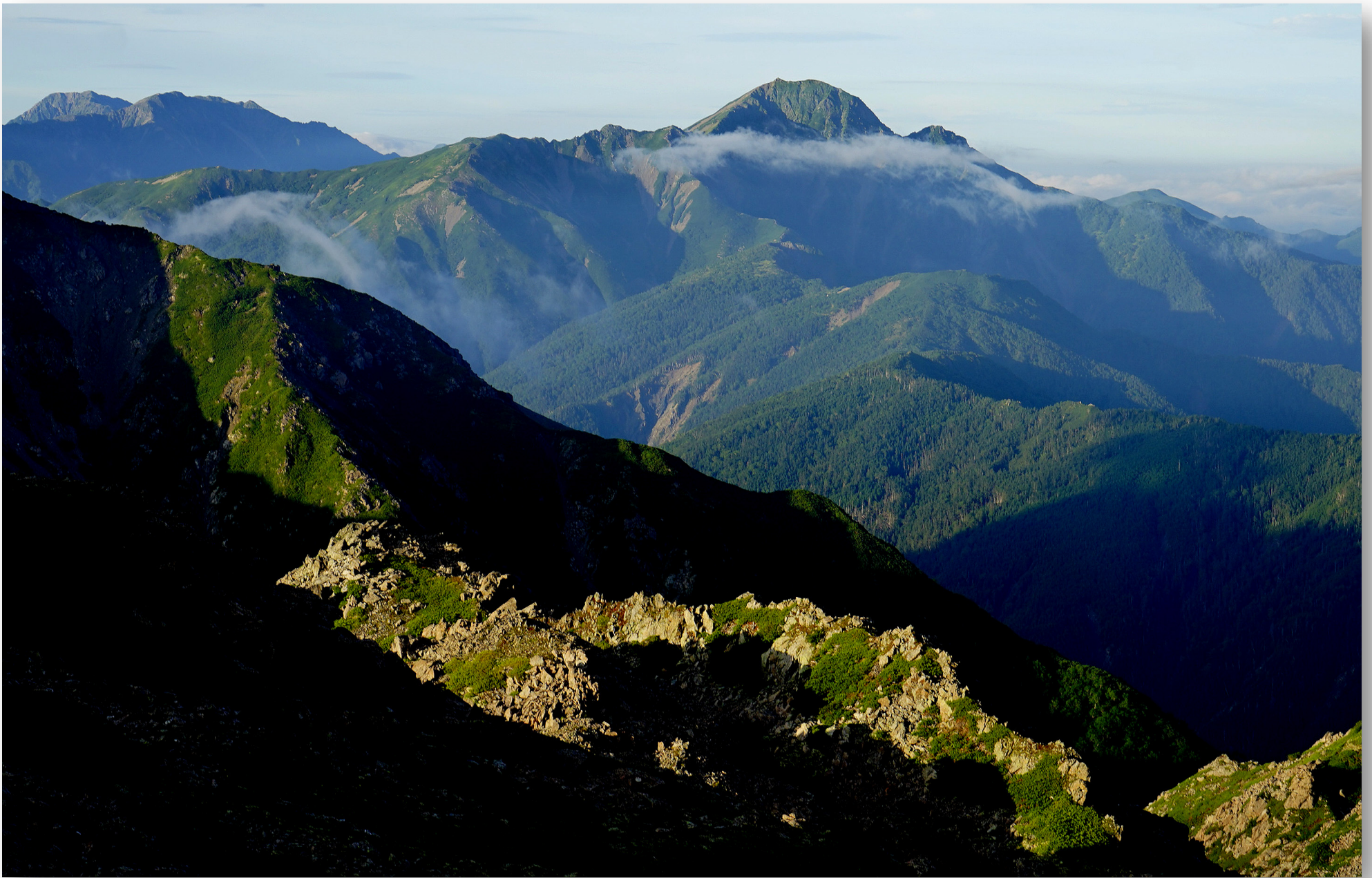
昨年12月、大雪で雲のあたりで敗退した塩見岳(3052m)。