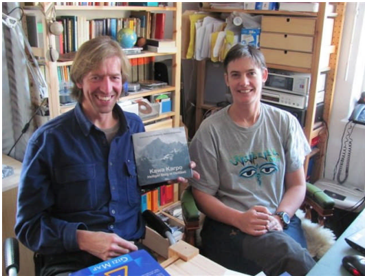
ドイツ生態学者と植物学者(右)