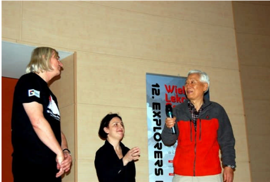
ウツ市大学での講演