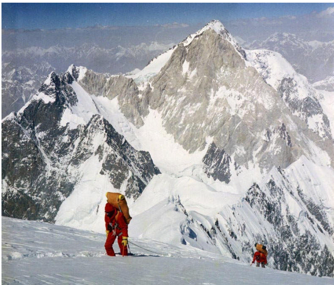
K2 7,600m 地点からクルチャップさんが撮ったスキャン・カンリ

1976年、カラコラムのスキャン・カンリ7544mを初登頂(永田秀樹、藤大路美興)した学習院隊とポーランドのクルチャップ指揮するK2登山隊とベースキャンプで交歓する。そして34年の歳月を経て登攀隊長だった贅田さんとクルチャップさんはポーランドで再会する。