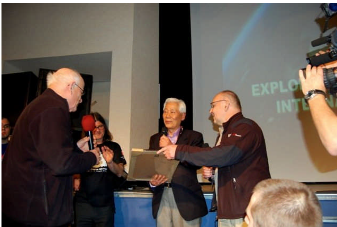
ポーランド山岳協会の名誉会員認証

2回の講演にあたり、たいへん優秀な女性の通訳（英語・ポーランド語）に恵まれたことは幸이었다。