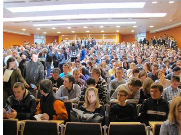
大学講堂 700 人の学生

ウツ市は人口 65 万人、社会主義体制時代に繊維産業(ソ連に輸出)で栄えたが、第二次大戦中にドイツにより徹底的に破壊された。空爆をされなかった古都、クラクフとは対照的である。破壊による荒廃は後遺症として町の建物や雰囲気に残っている。探検家フェスティバルは町興の企画としてウツ・トレッキングクラブが主宰し実行しているウツ市のプロジェクトであるが、ポーランド山岳協会も積極的にサポートしている。